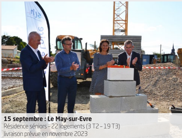
15 septembre : Le May-sur-Evre Résidence séniors - 22 logements (3 T2 - 19 T3) livraison prévue en novembre 2023