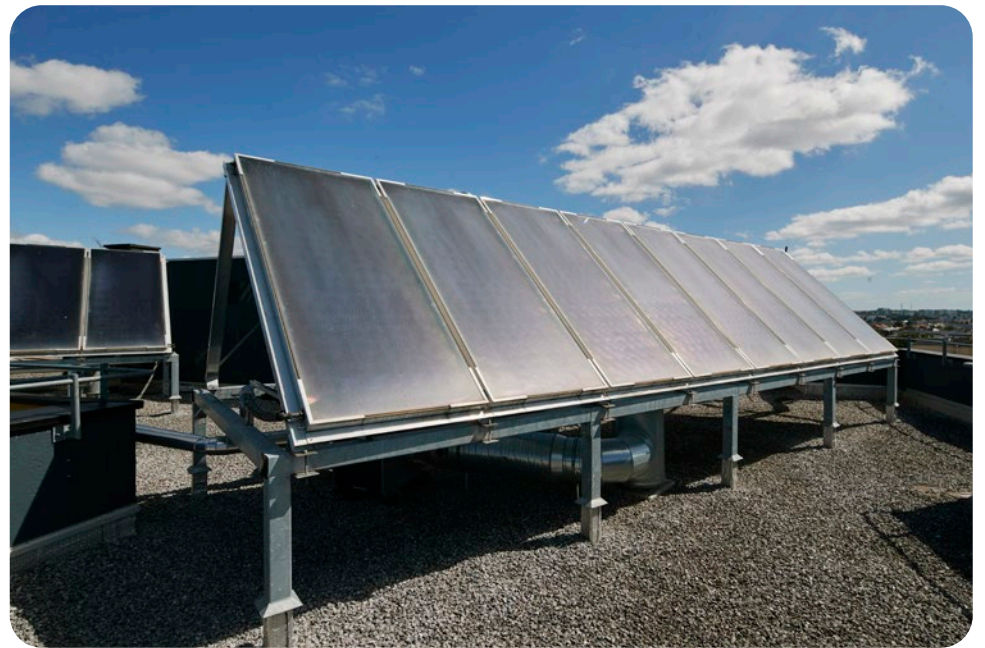
Panneaux photovoltaïques de Villeneuve

La volonté de vous aider à maîtriser vos charges s'est traduite par un engagement précoce en faveur des économies d'énergie.